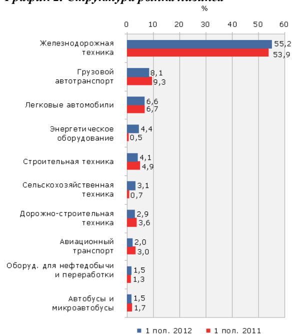
График 2. Структура рынка лизинга